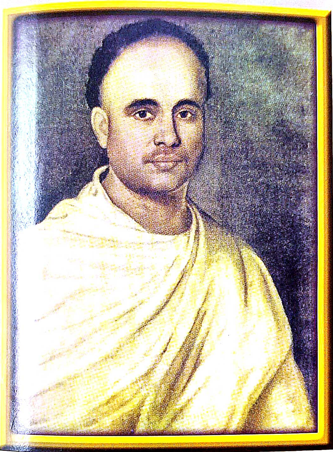
পণ্ডিত ঈশ্বরচন্দ্র বিদ্যাসাগর দ্বিশতবর্ষ (২০১৯-২০২০)