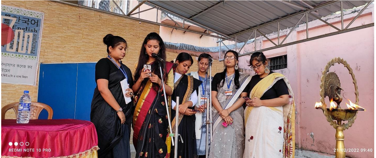
ছাত্রীদের সাংস্কৃতিক অনুষ্ঠান